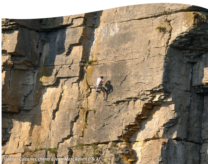
Falaises Calcaires, chères à Jean-Marc Boivin (I & A)

5 - Vignes d'appellation régionale Hautes Côtes de Beaune.