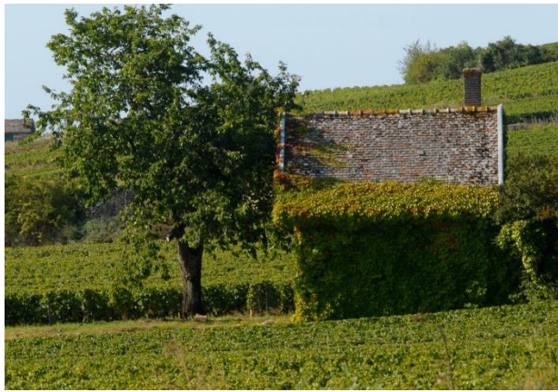
Beauner Weinberge