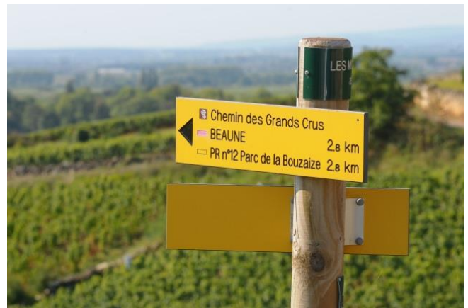
Markierte Wanderwege in der Region Pays Beaunois

150m weiter, an einer Weggabelung, rechts auf einen steinigen Weg zwischen zwei kleinen Mauern abbiegen 18 , anschließend gelangen Sie auf eine asphaltierte Straße. Links in die Rue de Sceaux abbiegen, die zum Eingang des Parks "Parc de la Bouzaize" führt.