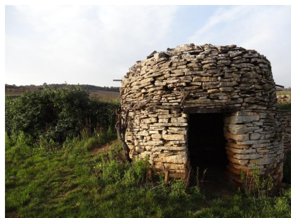
Kleine Steinhütten in den Weinbergen, die sogenannten « Cabottes »

DIE ERNTE UND BEPFLANZUNGEN BITTE RESPEKTIEREN. MÜLL NICHT LIEGENLASSEN.