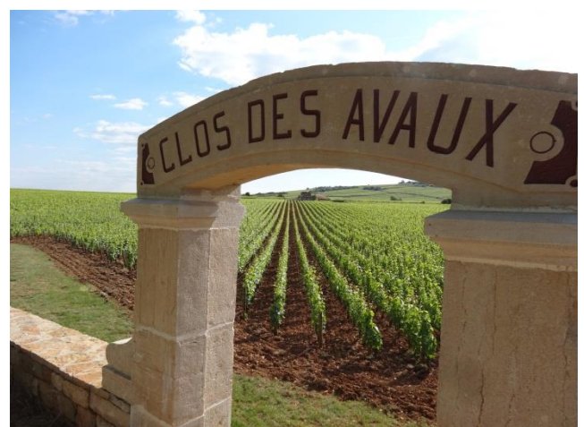
Clos des Avaux