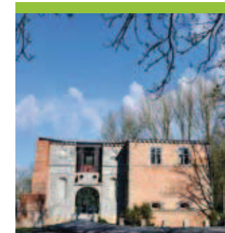
Le château de Boussu