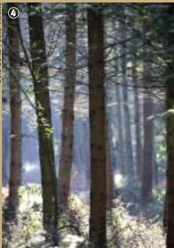
Bois de la Petite Villette

à fromage, passoires, tamis... les fabrications furent très vite liées au travail textile et au travail artisanal de la laine : rouets, fuseaux et fusette pour les dentellières. Par la suite s'ajoutèrent des jeux pour enfants comme les toupies et pour les adultes comme les boules et les quilles.