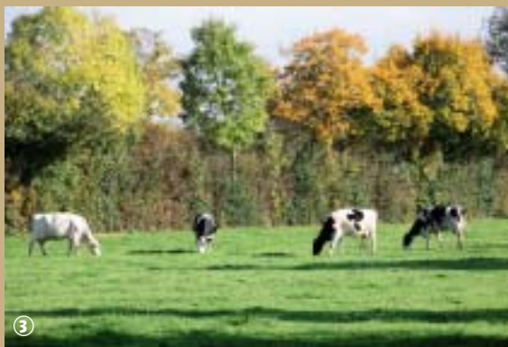
Pâturage dans la vallée de l'Helpe Majeure

Jusqu'à la Révolution, Felleries n'était qu'un village de clairière. Relativement isolée des villages voisins et totalement entourée d'un vaste ensemble forestier appelé « haie d'Avesnes », la commune vivait alors dans un écrin de verdure, une terre bénie avec son abondance d'essences variées où dominaient plus particulièrement le chêne, le hêtre, le frêne, le peuplier, le bouleau, l'érable et aussi le charme. Ce dernier, sous sa forme « têtard », est d'ailleurs devenu l'emblème du Parc naturel régional de l'Avesnois, c'est pour dire !