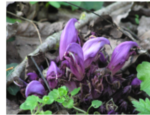
La lathræe clandestine apprécie les pentes humides et ombragées de la vallée du Lambon