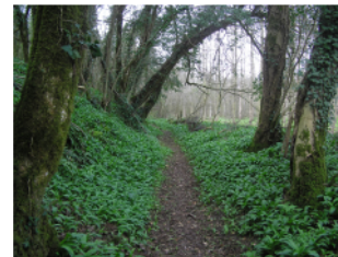
Tapis verdoyants d'ails des ours