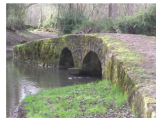
Un des nombreux ponts romans enjambant le Lambon

de taille proposent de nombreux habitats naturels pour la faune et la flore. Un sentier pédestre très arboré d'environ 1 km, en boucle, permet une randonnée sympathique et familiale où des bornes géologiques identifiées à Cinq Coux.