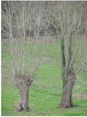
Arbres taillés en têtard