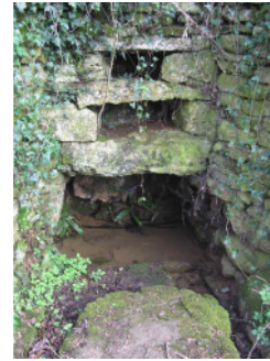
L'eau est omniprésente

Au début des années 1990, la Communauté cantonale de Celles-sur-Belle a choisi de valoriser cet ensemble. En effet, la carrière possède un réel intérêt scientifique. D'une part, le public peut observer 30 millions d'années de sédiments. On peut également y voir des ammonites « déroulées » (Spiroceratidae) et puis enfin l'ancienneté de l'exploitation de la carrière, sa superficie et la présence d'un front