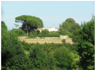
Pin parasol, marqueur du paysage en pays protestant