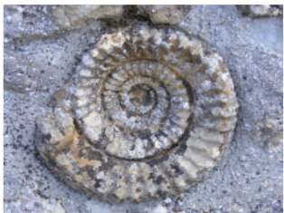
Il y a encore peu de temps, on pouvait admirer cette belle ammonite imbriquée dans un mur en pierre, mais l'appétit d'un collectionneur a été le plus fort ...