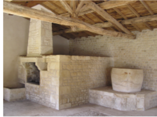
Le four et sa ponne qui servaient pour la "bujhaille" (lessive)

Cette balade vous propose la visite originale d'un village : vous pourrez découvrir son sous-sol à travers la visite d'une carrière aujourd'hui réaménagée pour le grand public : la carrière de Cinq Coux. Cette commune a la particularité d'être coupée en deux par une départementale, de là découle deux paysages différents : d'un côté des parcelles délimitées par un réseau de haies plus ou moins denses et de l'autre des champs à perte de vue.