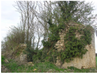
De la métairie de la Métrodière, il ne reste que des ruines