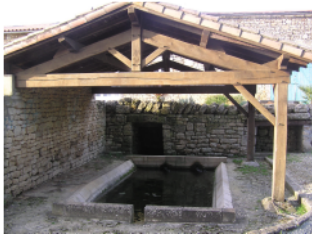
Le lavoir communal où jadis les femmes du bourg venaient "tatusser" (bavarder) tout en lavant leur linge