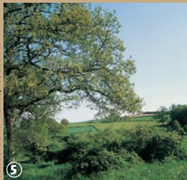
Vallée de la Hante, Coussore.

vécue de l'exploitation des carrières marbrières. Coussore, ville bénit par les rois puisque Charlemagne s'y serait rendu en pèlerinage. D'autres édifices témoignent de la piété de la ville, comme un presbytère de 1621, une chapelle du XVI e siècle, la Chapelle du Dieu de piété et surtout l'église Saint-Martin, à l'intérieur de laquelle deux statues en bois représentent les parents de Sainte-Aldegonde. Les amoureux de la nature et de la pêche seront, quant à eux, ravis du