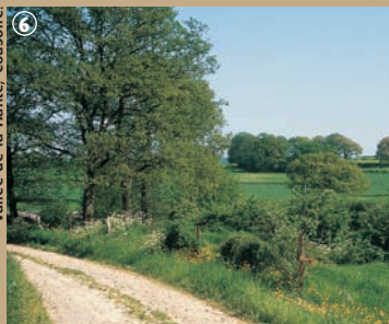
Vallée de la Hante, Coussore.

vécue de l'exploitation des carrières marbrières. Coussore, ville bénit par les rois puisque Charlemagne s'y serait rendu en pèlerinage. D'autres édifices témoignent de la piété de la ville, comme un presbytère de 1621, une chapelle du XVI e siècle, la Chapelle du Dieu de piété et surtout l'église Saint-Martin, à l'intérieur de laquelle deux statues en bois représentent les parents de Sainte-Aldegonde. Les amoureux de la nature et de la pêche seront, quant à eux, ravis du