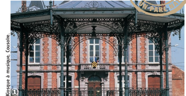
Kiosque à musique, Coussore.