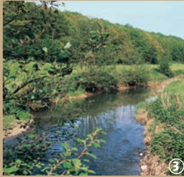
Vallée de la Hante, Coussore.

Au cœur de l'Avesnois, entre pâturages et rivières, les chemins ondulent entre la France et la Belgique et laissent entrevoir un patrimoine bien caché. Les amateurs d'art seront peut-être surpris d'apprendre que certaines cheminées du Château de Versailles furent réalisées dans les marbreries locales, Coussore ayant longtemps