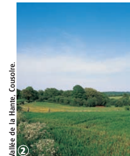
Vallée de la Hante, Coussore.