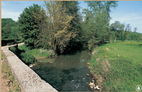
Pont courroux sur la Hante.