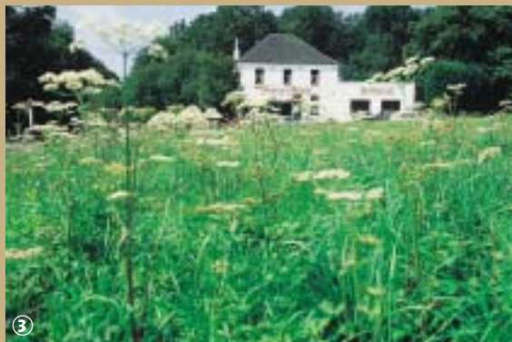
Auberge du Courcou

Au cœur de la forêt de Mormal, au voisinage des grands chênes, un estaminet-ferme est devenu auberge.