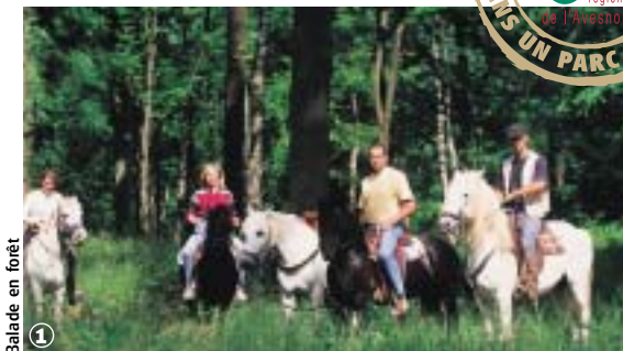
Balade en forêt