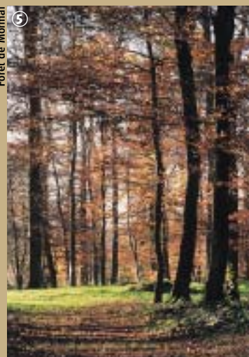
Forêt de Mormal

Autrefois, les occupants des maisons forestières se devaient de respecter le droit de tout voyageur à recevoir gratuitement un godet d'eau (godeau en patois). De cette coutume d'hospitalité, l'auberge du Godelot a peut être tiré son nom.