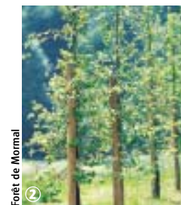
Forêt de Mormal