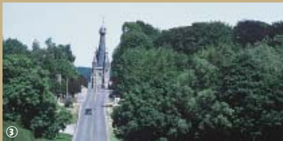
Solre le Château : le clocher penché

Le clocher de l'église de Solre-le-Château est célèbre pour son évidente inclinaison, mais cette obliquité ne constitue pas sa seule particularité !