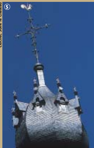
Clocher, Solre le Château

Les habitants de Solre-le-Château, très fiers de leur clocher, y voient un beau cerge élevé à la gloire du Seigneur !