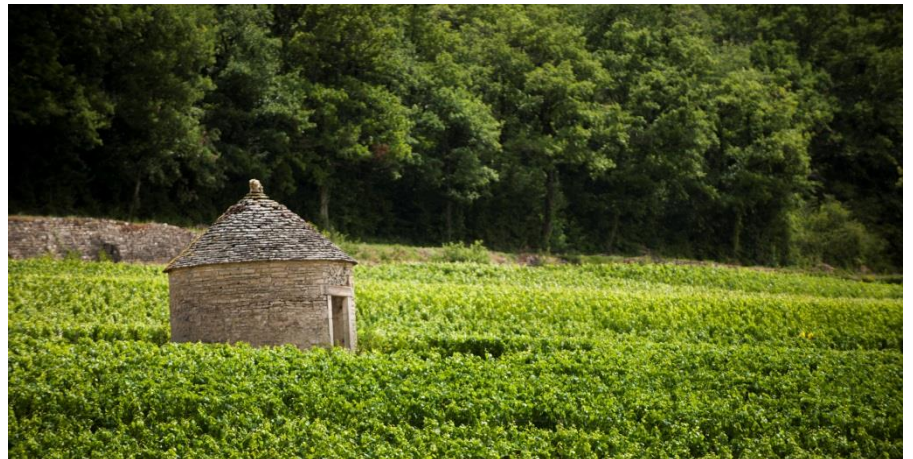
Kleine Steinhütten in den Weinbergen, die sogenannten « Cabottes »

DIE ERNTE UND BEPFLANZUNGEN BITTE RESPEKTIEREN. MÜLL NICHT LIEGENLASSEN.