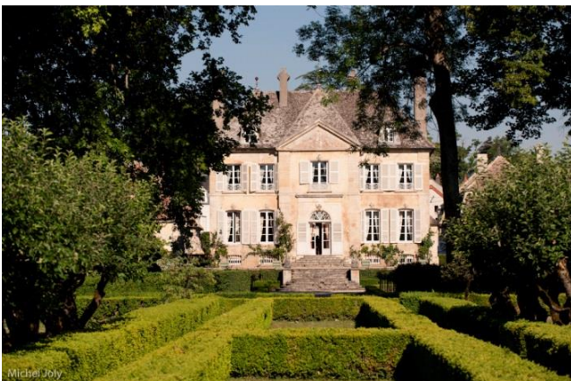
Das Manoir « Chandon de Briailles »

Gegenüber den Schotterweg, der einer Mauer entlang führt, nehmen. Rechts, in der Nähe einer Quelle abbiegen. Am Ende des Waldes den Weinberg entlang laufen, bis zu einer Mauer, links abbiegen und den asphaltierten Weg hinaufgehen. Am Ende des Anstieges