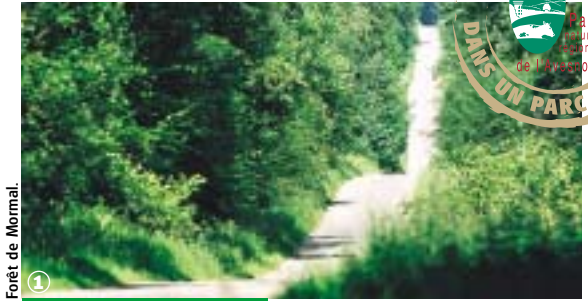
Forêt de Mormal.

Bavais, Pays Quercitain, forêt de Mormal, 2000 ans d'histoire à contempler