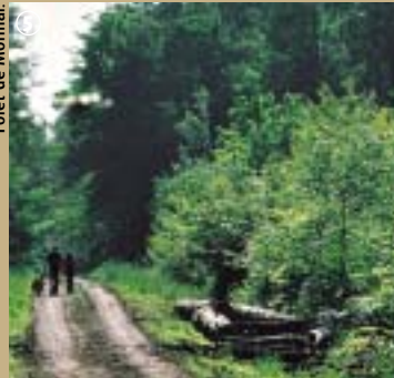
Forêt de Mormal.

Georges. Cette source est reconnue de très bonne qualité, la forêt jouant un rôle de filtre en freinant le ruissellement et en favorisant l'infiltration de l'eau dans le sol. Peut-on y voir une des explications à la réputation de guérisseuse qu'a longtemps eu la fontaine d'Englefontaine ? En effet, elle était censée remédier aux maladies de peau et autres infections cutanées connues sous le nom de « bobos Saint Georges », ainsi qu'aux problèmes d'yeux. Des pèlerinages attiraient de nombreux fidèles venus remplir leur fiole de cette eau « miraculeuse ». Mais ce ruis-