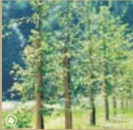
Forêt de Mormal.

Au fil des saisons, la forêt de Mormal change de visage. A l'automne, elle se transforme en véritable château d'eau : quand le sol est gorgé d'eau, de nombreux ruisseaux apparaissent et creusent les terres. Parmi eux figurent le Saint