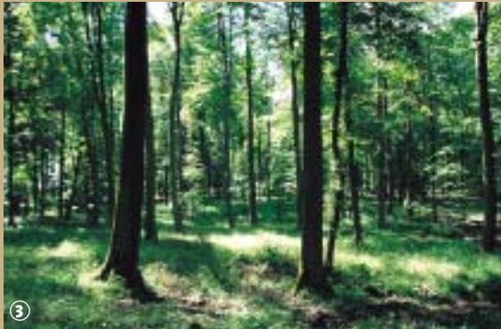
Forêt de Mormal.

Au fil des saisons, la forêt de Mormal change de visage. A l'automne, elle se transforme en véritable château d'eau : quand le sol est gorgé d'eau, de nombreux ruisseaux apparaissent et creusent les terres. Parmi eux figurent le Saint