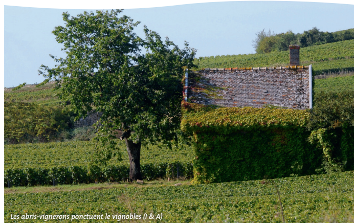
Les abris-vignerons ponctuent le vignoble (I & A)

poursuivre en descendant, en direction de la maisonnette. Le chemin devient vaguement goudronné et passe près d'une belle construction circulaire en pierres sèches. 12 et 13