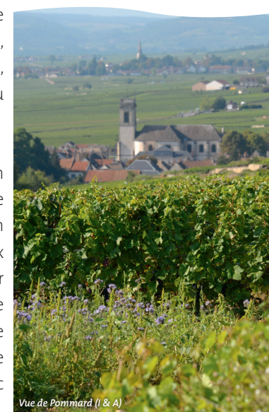
Vue de Pommard (I & A)

150 m plus loin, à un embranchement, prendre à droite un chemin empierré entre deux murets 18 , puis déboucher sur une route goudronnée et prendre à gauche la rue de Sceaux qui permet de regagner l'entrée du parc de la Bouzaize.