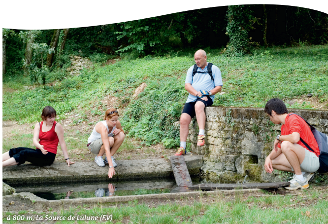
à 800 m - La Source de Lulune (EV)

8 - Sur la droite, au-dessus du vignoble, site de Montremenot : de gigantesques pierriers sont visibles ; certains sont vraisemblablement des vestiges de fortifications d'origine gauloise ; l'épaisseur des murs principaux était de plusieurs mètres. Au XV ème siècle un ermite habita dans les ruines du camp (ermitage Saint Désiré).