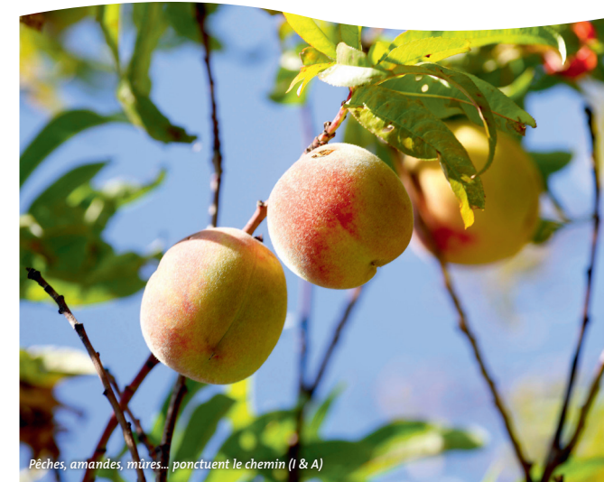
Pêches, amandes, mûres... ponctuent le chemin (I & A)