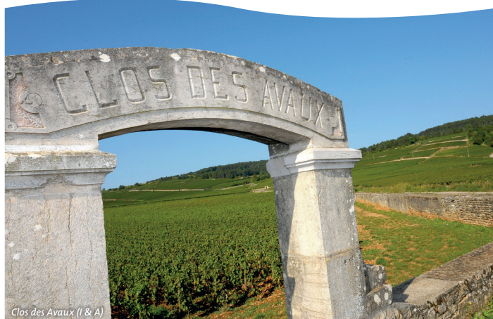
Clos des Avaux (I & A)

Laisser à droite le chemin qui descend au Clos des Mouches 11 et