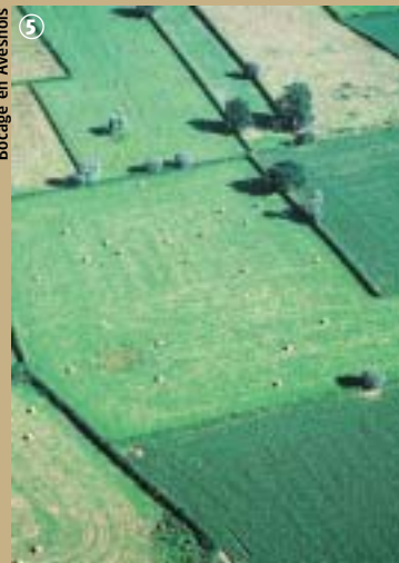
Bocage en Avesnois

Quant au Charme têtard, arbre des plus « généreux », il fournit le plus