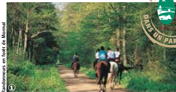
Randonneurs en forêt de Mormal