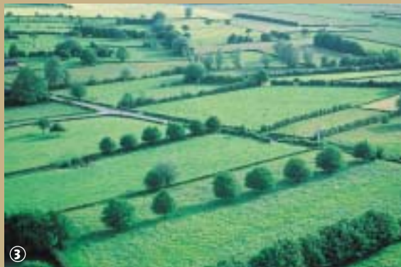
Paysage de bocage

Mosaïque de prairies encloses de haies taillées, le bocage construit et entretenu par l'Homme, est l'illustration parfaite de l'alliance possible entre l'Homme et la nature. Dense et diversifié, il constitue une richesse naturelle d'intérêt écologique majeur, en favorisant la