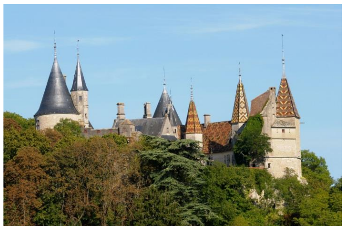
Château de la Rochepot

Auf dem Berg, an der Kreuzung ( Schild P57 ), wenn man Baubigny sieht, links abbiegen und immer bergauf laufen. Unten an einem Weinberg entlang. Der Pfad führt dann durch die Buchsbäume und steigt sacht auf 1km in Richtung der Pinienbäume an.