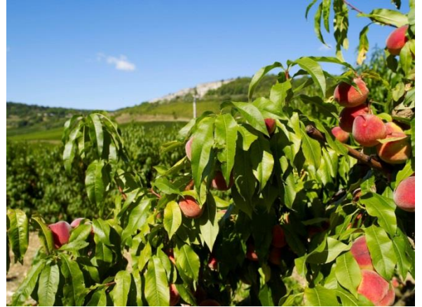
Hautes Côte de Beaune

6 – Auf dem Hügel des « Schlosses » (« Château ») Ausblick auf die Dörfer Orches, Évelle und Baubigny, welche gemeinsam die Gemeinde Baubigny bilden.