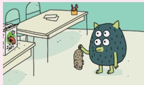
Le Hamster fétiche