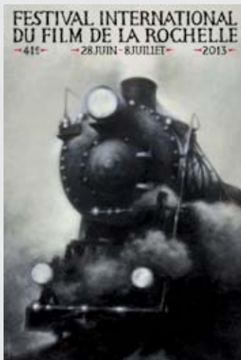
Affiche 2013 de Stanislas Bouvier