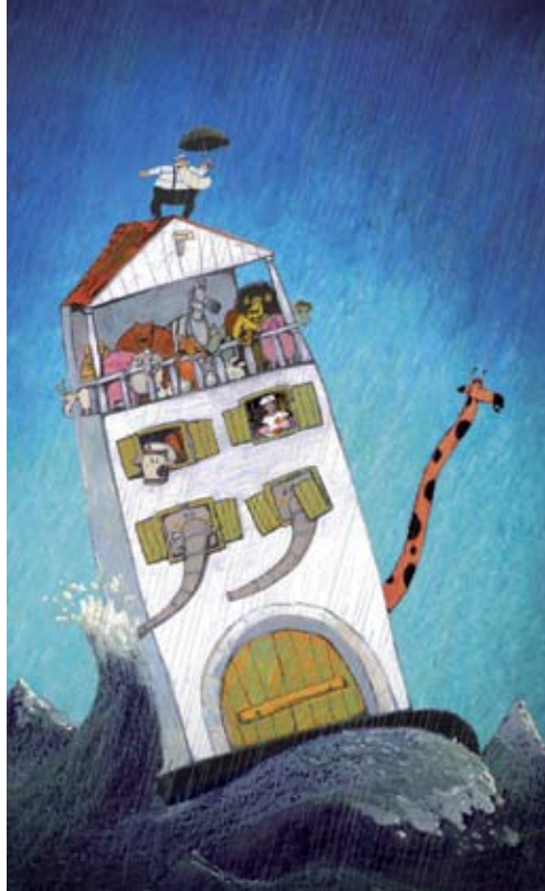
La Prophétie des grenouilles