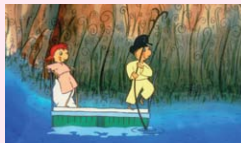
Le Voyage d'une goutte d'eau

Ma petite planète chérie à partir de 5 ans 1/7 à 10h • 4/7 à 10h • Dragon 1