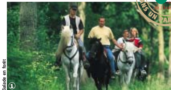
Balade en forêt