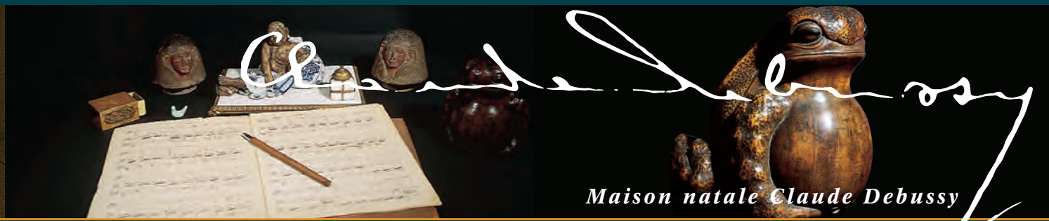
Maison natale Claude Debussy