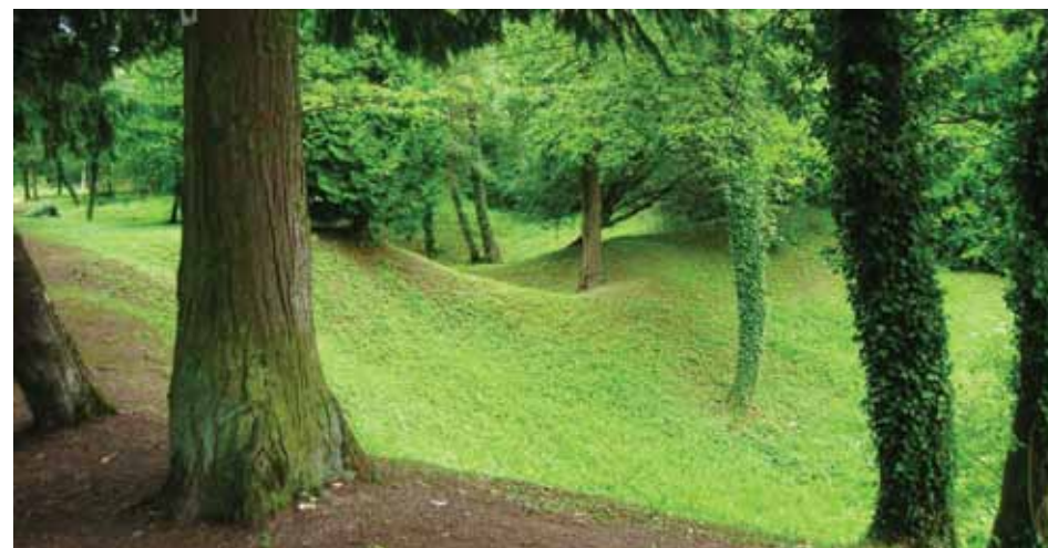
L'éperon des Éparges.