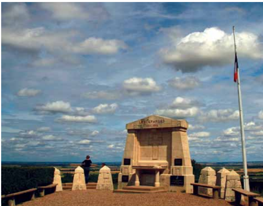
Le monument du Point X.

Rejoignez-nous et randonnez l'esprit libre