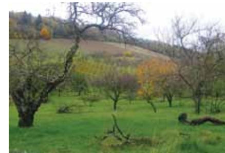
Paysage de Côtes.

7 Redescendre vers le village des Éparges en empruntant le sentier pénétrant dans la forêt par Larvau (passages boueux). Atteindre la ferme du Sonvaux, franchir sur un pont le Longeau, puis déboucher sur la D 154. Tourner à droite vers la mairie et rejoindre le point de départ.