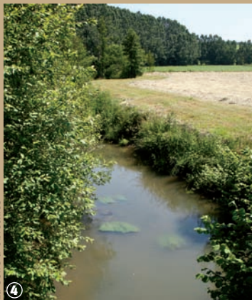
La Solre à Obrechies

une étape nécessaire dans la protection de la nature en matière de développement durable. Ce réseau représente un atout économique pour certains secteurs ruraux ainsi qu'un label de qualité paysagère et écologique, entraînant une mise en valeur touristique non négligeable de certains terroirs. Donnant la possibilité de réfléchir ensemble localement sur notre devoir de préservation de la planète, il nous fait notamment prendre conscience que pour que les poissons reviennent chaque année dans l'herbier aquatique de nos rivières, il faut sauvegarder leur habitat !