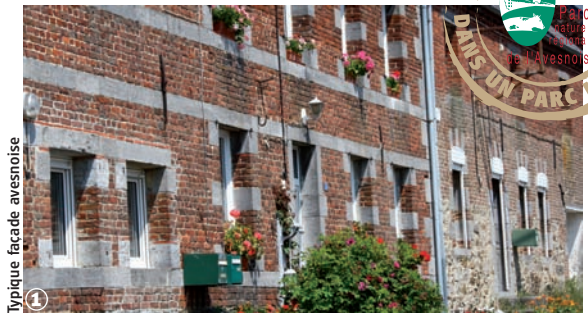
Typique façade avesnoise

Randonnée Pédestre Le chemin des écoliers d'Obrechies : 6 km